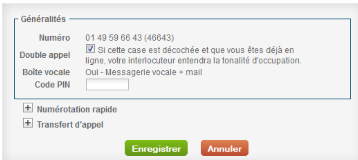
Figure 3 : Gestion du téléphone